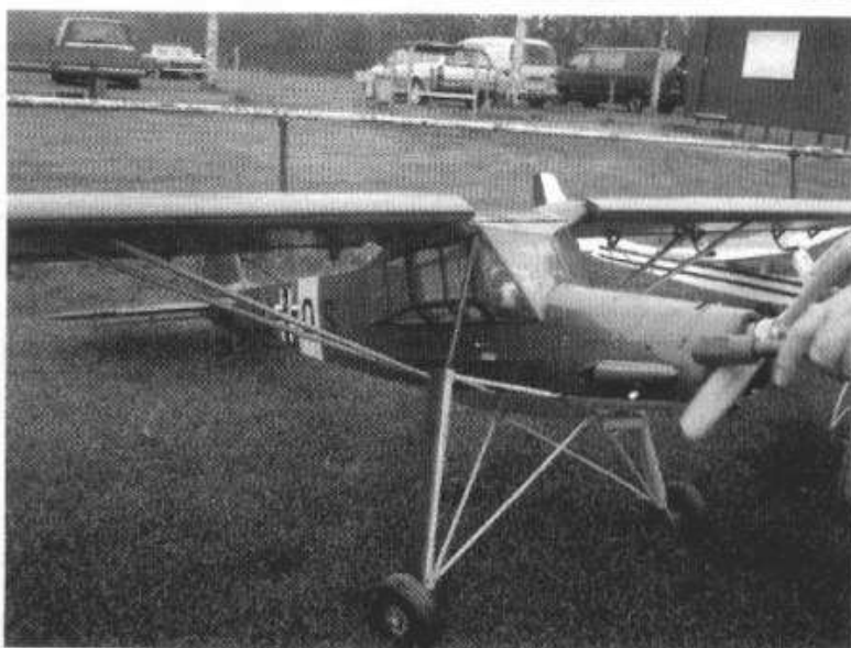
Deze Storch van Henk Germs is de laatste aanwinst van hem.

Alle kosten (contributie en materiaal) worden vergoed door de COA. De vraag is dan ook wie (uiteeraard goede) zender en of vliegtuig opzette en beschikbaar wil stellen. Voorlopig is het een proef met de duur van een jaar. Ze komen elke dinsdagavond modelvliegen vanaf aanstaande dinsdag. Dus wie materiaal beschikbaar heeft graag tot dinsdag avond. Er is toegezegd dat het materiaal "ruim" zal worden vergoed!