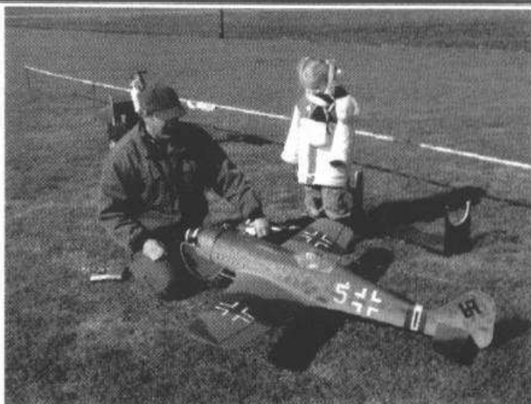
Cor Cocks met zijn dochter en zijn jongste aanwinst deze prachtige Focke Wulf