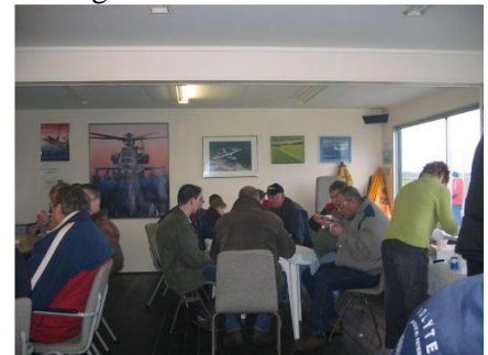
Er was geen stoel in het clubhuis meer vrij

Juist omdat het zo koud was liet een ieder zich de warme snert en bonensoep goed smaken, en het was dan ook behoorlijk druk in en rondom ons altijd gezellige clubhuis, waar iedereen zichtbaar zat te genieten van al dat lekkers.